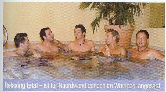
Relaxing total – ist für Nordwand danach im Whirlpool angesagt

Diese jungen Musikanten gehören zur neuen Generation der Schlagerstars und zeigen, dass man für den wirklich großen Erfolg nicht nur eine schöne Stimme, sondern sehr wohl auch ein entsprechendes Äußeres braucht.