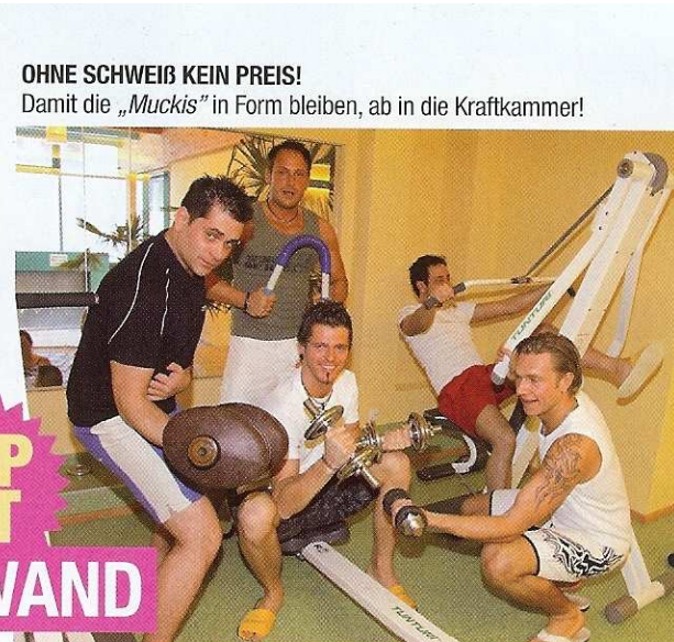
OHNE SCHWEIß KEIN PREIS! Damit die „Muckis“ in Form bleiben, ab in die Kraftkammer!